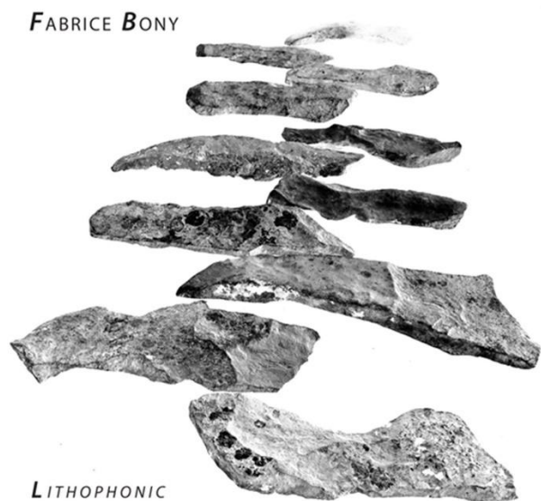
Fabrice BONY - Lithophonie